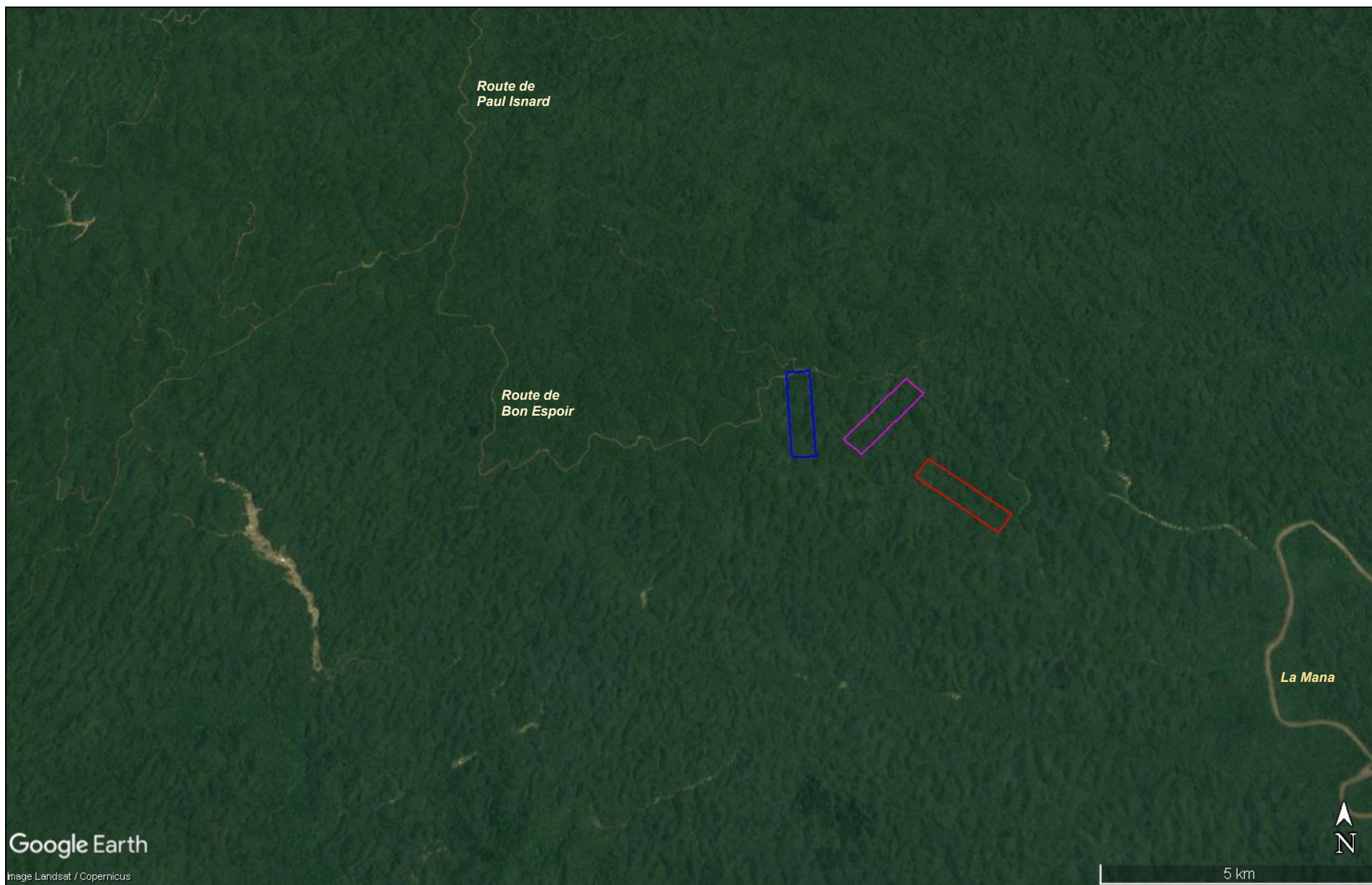
Vue satellitaire éloignée de la zone de l'ARM de 3 km 2 « Affluent Mana branche Nord » et « Affluent Amadis Nord » de la SAS LPDO